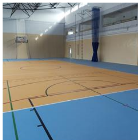
Sala gimnastyczna Zespołu Szkolnego w Stanisławowie

Gminny Ośrodek Kultury w Stanisławowie jest główną instytucją realizującą działania w sferze kultury i dziedzictwa narodowego. W budynku GOK-u swoją siedzibę ma ośrodek wsparcia w formie klubu samopomocy Klub Senior + oraz Uniwersytet Trzeciego Wieku, które skupiają seniorów. Ośrodek współpracuje z innymi instytucjami kultury, podmiotami prowadzącymi działalność kulturalną, stowarzyszeniami i związkami twórców i artystów oraz organami władz publicznych zajmujących się działalnością kulturalną a także z placówkami oświatowymi.