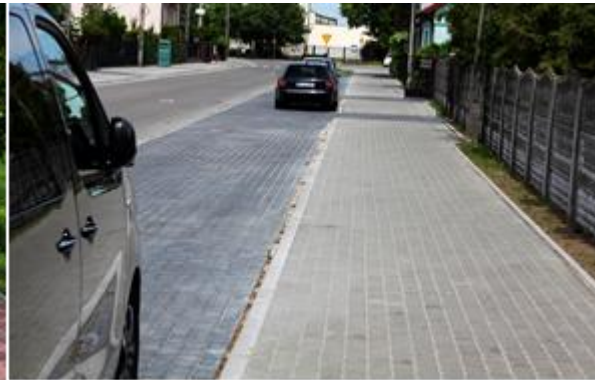
Ulica Radzywińska w Stanisławowie