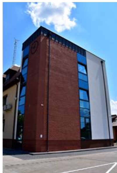
Urząd Gminy Stanisławów

Uwarunkowania urbanistyczne i komunikacyjne są typowe dla małych miasteczek. Przez Stanisławów przechodzą ważne szlaki komunikacyjne droga krajowa nr 50 z południa na północ Grójec – Ostrów Mazowiecka i z zachodu na wschód droga wojewódzka nr 637 z Warszawy do Węgrowa. Osada leży w odległości 11 km na północny-zachód od Mińska Mazowieckiego i 40 km na wschód od Warszawy. W centrum miejscowości przy drodze wojewódzkiej usytuowany jest rynek z pięknym zmodernizowanym w 2020 r. parkiem i ogrodem deszczowym. Przy parku umiejscowiony został budynek Urzędu Gminy, w którym swoją siedzibę ma również Gminny Ośrodek Pomocy Społecznej. Przy urzędzie gminy mieści się komisariat policji obejmujący swym działaniem 3 gminy: Stanisławów, Dobre i Jakubów oraz Gminny Ośrodek Kultury. Nieopodal znajduje się zabytkowy kościół z I połowy XVI w. z dzwonnica, Zespół Szkolny z salą gimnastyczną, nowoczesnym przedszkolem i Gminnym Żłobkiem.