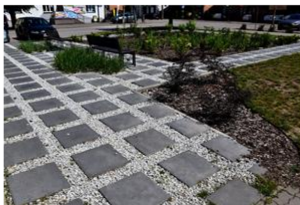
Ogród deszczowy na rynku Stanisławowa