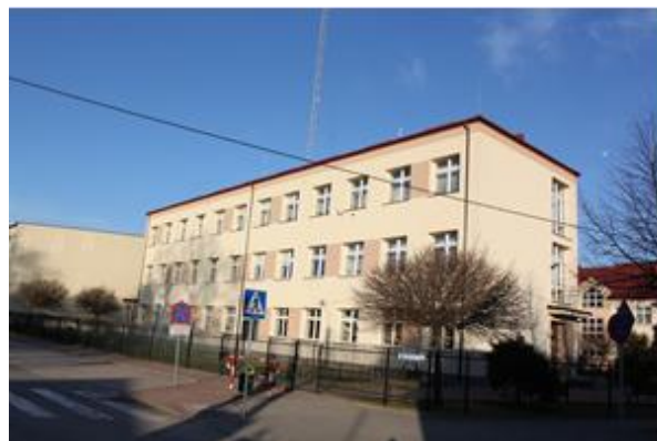
Zespół Szkolny w Stanisławowie