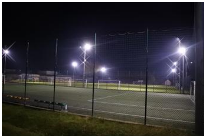
Boisko w Stanisławowie

Przy zespole szkolnym znajduje się plac zabaw i pełnowymiarowe boisko do piłki nożnej, które jest wykorzystywane również na potrzeby dużych gminnych imprez. W Stanisławowie działa Uczniowsko-Parafialno-Ludowy Klub Sportowy.