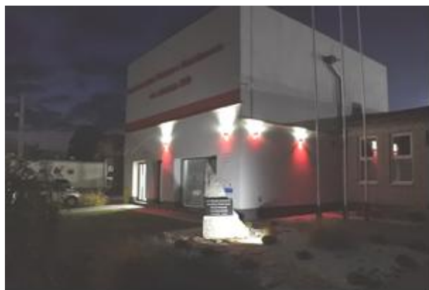
Strażnica OSP Stanisławów

Ponadto w Stanisławowie mieści się oddział Banku Spółdzielczego, Urząd Pocztowy, apteka i punkt apteczny, a także liczne obiekty handlowe, usługowe i produkcyjne: Zakłady Mięsne Stanisławów, Plastan Sp. z o. o., Sp. k., 2 stacje paliw, 2 myjnie samochodowe, centrum ogrodniczo-budowlane, 3 sklepy z art. budowlanymi, 2 cukiernie, 2 kwaciarnie, 3 markety handlowe, sklepy spożywcze, 2 zakłady produkcji mebli, 4 zakłady mechaniki pojazdowej,