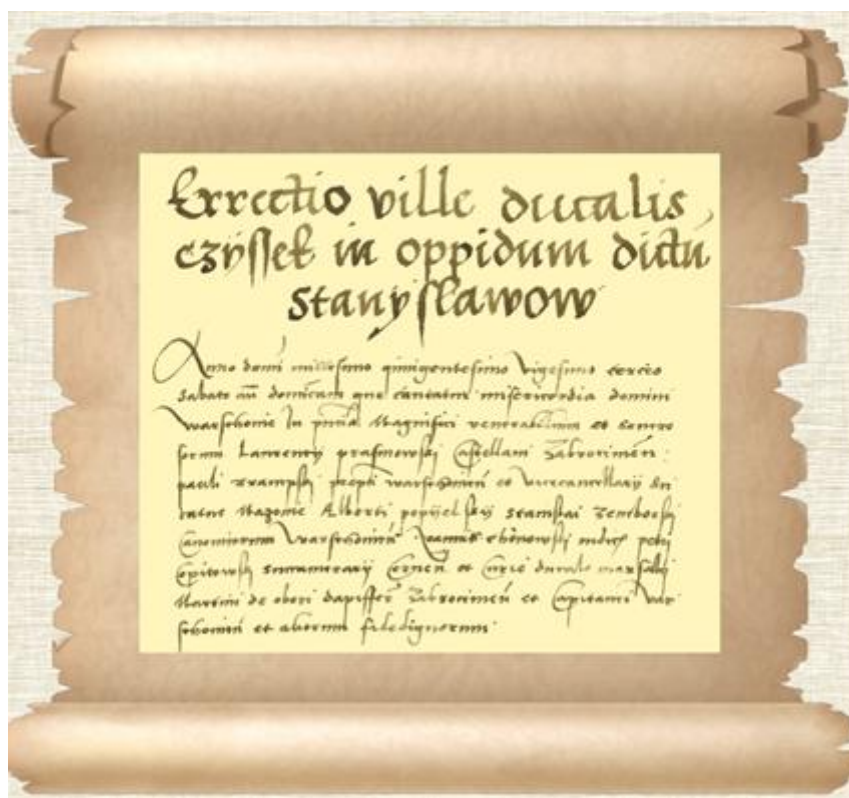
Akt nadania praw miejskich dla Stanisławowa

Stanisławów to pierwotnie osada leśna Cisek, leżąca przy ważnym szlaku handlowym z Warszawy przez Liw na Litwę. Wzmiankowana w źródłach już w 1361 r. W XIV wieku należy do rodziny szlacheckiej z Łowczewa herbu Kościeszka. Na początku XV wieku przechodzi na własność Janusza I Księcia Mazowieckiego, który 30 grudnia 1418 roku przenosi wieś Cisek na prawo niemieckie. Sołtys otrzymuje cztery łany ziemi pod uprawę. Istnieje tu już wtedy młyn rudny. Powstaje tu wówczas także przydrożne targowisko i książęcy dwór myśliwski. Cisek się rozwija a rozwój ten stymulują głównie funkcje targowe tej wsi. Doprowadzają one do nadania jej prawa miejskiego chełmińskiego. Wystawcami dokumentu byli książęta mazowieccy Stanisław i Janusz III, którzy w dniu 2 maja 1523 roku podpisali akt lokacyjny miasta. Nowo lokowane miasto otrzymało nazwę Stanisławów od starszego z braci.