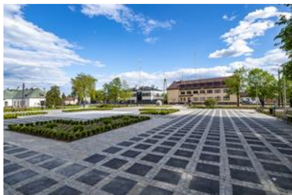
Centrum rynku Stanisławowa