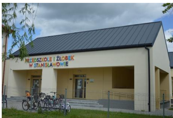
Przedszkole i żłobek w Stanisławowie

Placówka obecnie posiada 30 miejsc żłobkowych dla dzieci w wieku od 12 miesiąca do 3 lat. Według stanu na dzień 31 grudnia 2024 r. do Gminnego Żłobka w Stanisławowie uczęszczało 27 dzieci.