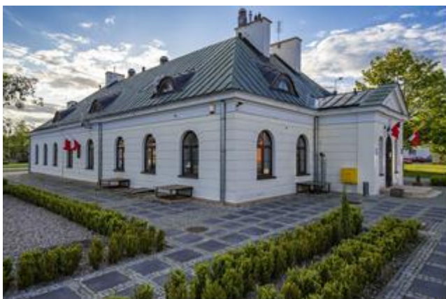
Gminny Ośrodek Kultury w Stanisławowie