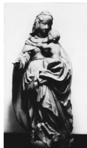
Rzeźba Matki Boskiej

Parafia posiada liczne zabytki historyczne: