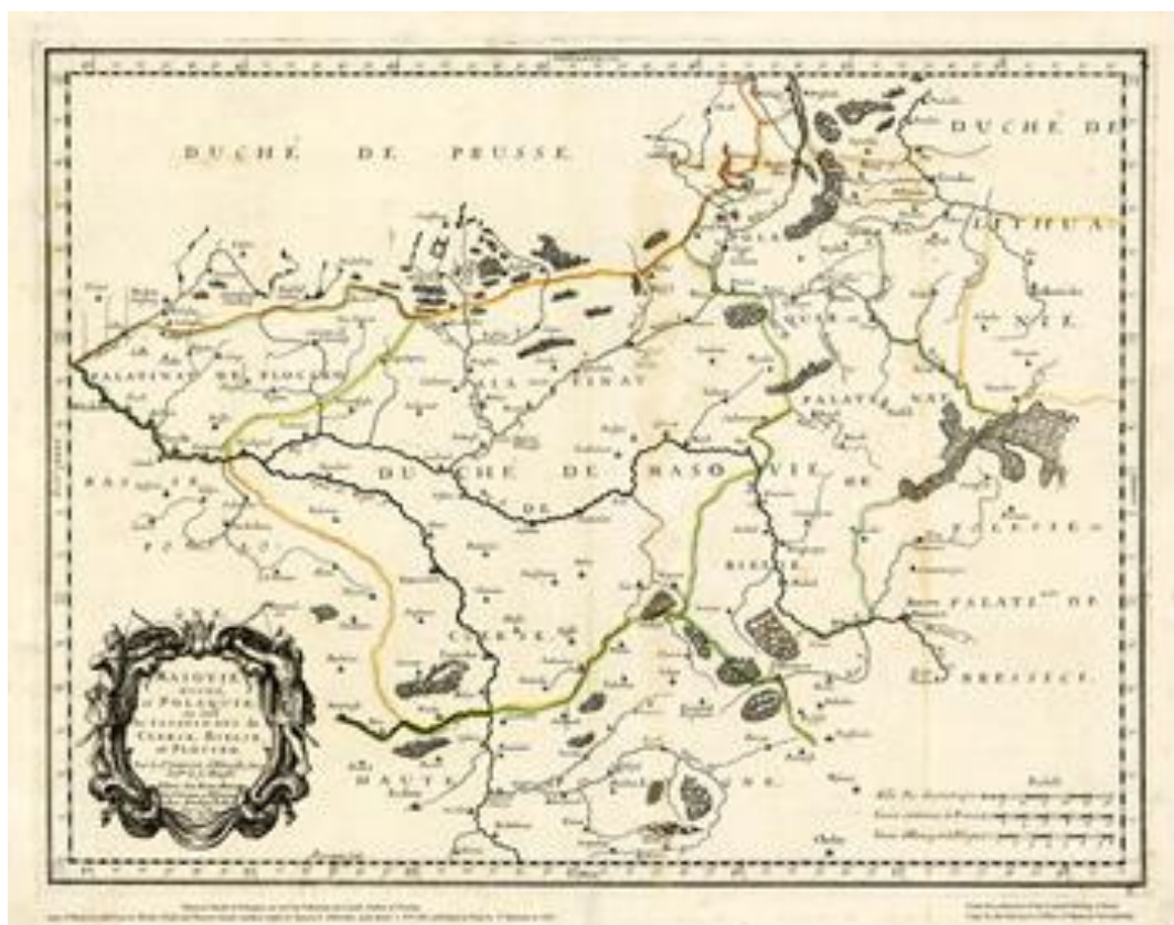
Mapa Mazowsza z roku 1664

staje się odtąd siedzibą starosty niegrodowego czyli dzierżawcy dóbr królewskich. Należy tylko wspomnieć, że kolejni królowie Polski potwierdzali wcześniejsze przywileje miasta Stanisławowa.