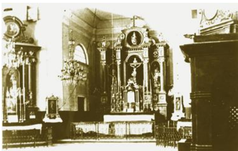
Ółtarz kościoła parafialnego w Stanisławowie - lata międzywojenne