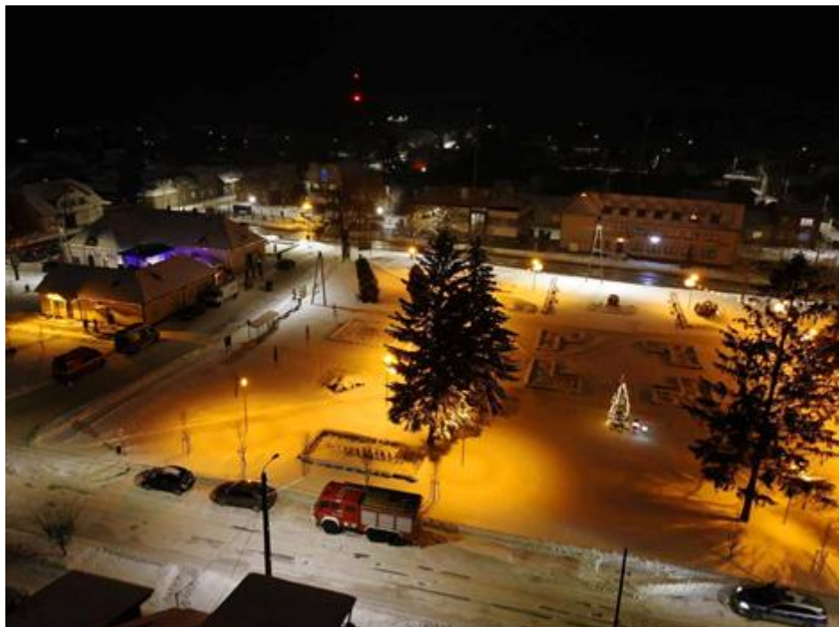
Widok centrum Stanisławowa z lotu ptaka.

Gmina Stanisławów leży na Nizinie Mazowieckiej, na granicy Równiny Wołomińskiej z Wysoczyzną Kałuszyńską. Z południowego wschodu na północny zachód przepływają malownicze rzeki Rządza i Czarna należące do zlewiska Narwi. Gmina Stanisławów jest gminą wiejską położoną w powiecie mińskim, województwie mazowieckim. Obszar gminy zajmuje 10 629 ha. Gmina Stanisławów graniczy z gminami: Dębe Wielkie, Dobre, Jakubów, Mińsk Mazowiecki, Poświętne, Strachówka i Zielonka. Na północy gminy rozciągają się pozostałości Puszczy Sulejowskiej, południe gminy zajmują pola. Na granicy gminy z gminą Dobre i z gminą Strachówka znajduje się torfowisko Czernik, zakwalifikowane do obszaru „Natura 2000” (głównie ze względu na gnieźdzące się tam żurawie). W skład gminy wchodzi 29 miejscowości wśród, których Stanisławów jest największy.