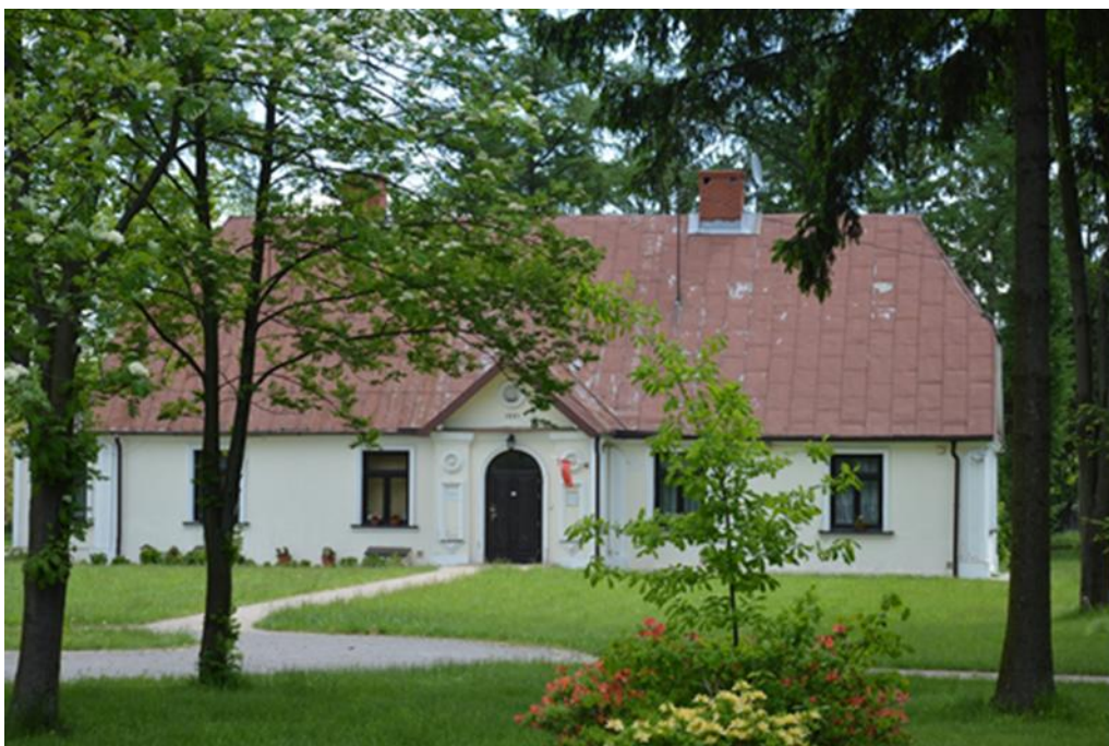
Plebania w Stanisławowie

Początkowo był to dom drewniany kryty gontami, długości 24 łokci, szerokości 13,5 a wysokości ścian 5 łokci. W środku domu znajdowała się kuchnia oraz dwie sienie: jedna od frontu, a druga od tyłu. Z sieni prowadziły schody na strych. Kuchnia i sienie dzieliły dom na dwie części. Po lewej stronie było mieszkanie proboszcza, składające się z jednej izby, alkierza i gabinetu, które ogrzewane było ceglanym piecem. Po stronie prawej znajdowały się dwie izby czeladne i dwie komory. Tę połowę domu również ogrzewał ceglany piec z dwoma kominami. Był też piec do pieczenia chleba. W całym domu wykonano podłogi drewniane z tarcic. Okna zaopatrzone w drewniane okiennice. Tak wyglądał dwór plebański w 1826 roku.