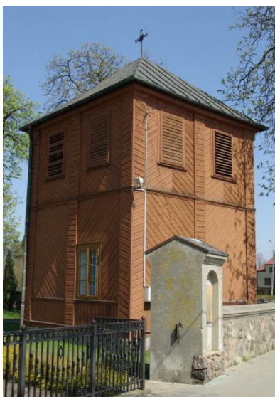
Dzwonnica drewniana przy kościele parafialnym w Stanisławowie

W otoczeniu kościoła znajduje się zabytkowa drewniana dzwonnica wybudowana w 1819 r. Dzwonnica zachowała się do chwili obecnej w dobrym stanie, wyposażona w jeden dzwon, uruchamiany energią elektryczną. Remontowany w XX w., budynek o konstrukcji słupowej, oszalowany, dach namiotowy kryty blachą. Dzwon znajdujący się w dzwonnicy został odlany w 1773r. w Warszawie przez Jana Zachariasza Neuberda. Zegar wieżowy pochodzący z XVI w. został uszkodzony w pożarze w 1944r.