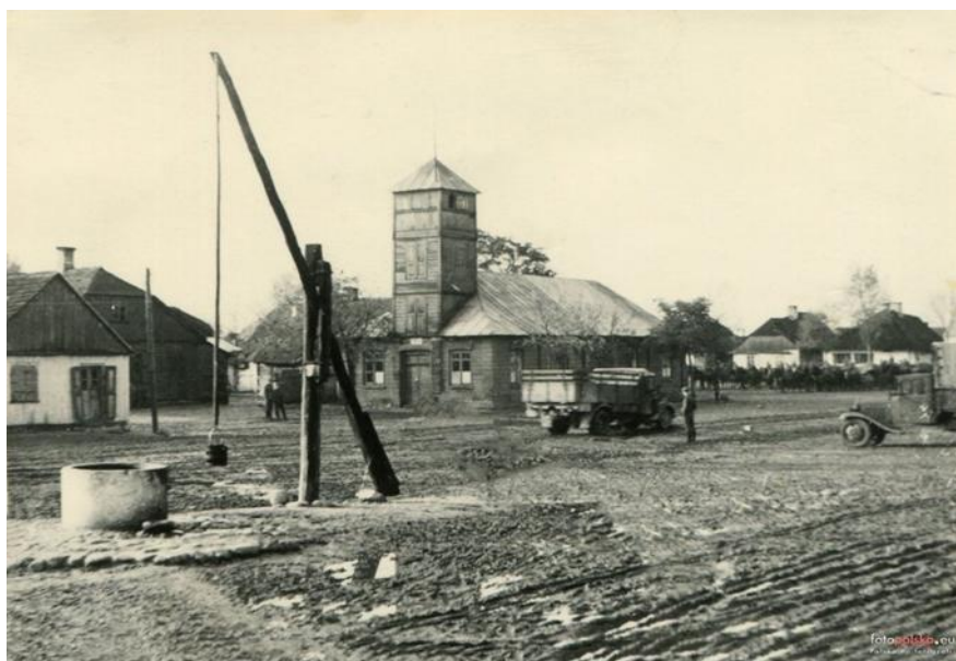
Widok wieży, z której grany by hejnał Stanisławowa

Miasto Stanisławów posiadało też hejnał.