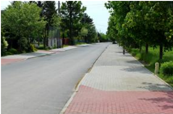
Ulica Cmentarna w Stanisławowie

Styl zagospodarowania miejscowości Stanisławów nosi typowe cechy dla przestrzeni miejskich: utwardzone place publiczne, parkingi, ciągi komunikacyjne i piesze, oświetlenie ulic i placów, infrastruktura techniczna. W miejscowości znajdują się 60 ulic, większość z nich posiada nawierzchnię ulepszoną. W centrum oraz poza centrum przy wielu ulicach są chodniki z kostki brukowej.