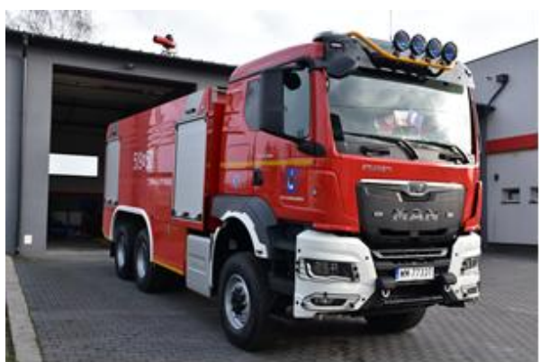
Wóz bojowy OSP Stanisławów

W Stanisławowie funkcjonuje ośrodek zdrowia, apteka i siedziba jednostki ochotniczej straży pożarnej, która została włączona do Krajowego Systemu Ratowniczo – Gaśniczego. W ramach jednostki działa również młodzieżowa i dziecięca drużyna pożarnicza.