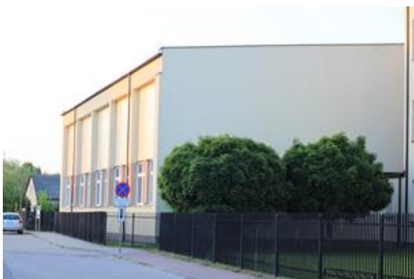
Sala gimnastyczna w Stanisławowie

Uwarunkowania urbanistyczne i komunikacyjne są typowe dla małych miasteczek. Przez Stanisławów przechodzą ważne szlaki komunikacyjne droga krajowa nr 50 z południa na północ Grójec – Ostrów Mazowiecka i z zachodu na wschód droga wojewódzka nr 637 z Warszawy do Węgrowa. Osada leży w odległości 11 km na północny-zachód od Mińska Mazowieckiego i 40 km na wschód od Warszawy. W centrum miejscowości przy drodze wojewódzkiej usytuowany jest rynek z pięknym zmodernizowanym w 2020 r. parkiem i ogrodem deszczowym. Przy parku umiejscowiony został budynek Urzędu Gminy, w którym swoją siedzibę ma również Gminny Ośrodek Pomocy Społecznej. Przy urzędzie gminy mieści się komisariat policji obejmujący swym działaniem 3 gminy: Stanisławów, Dobre i Jakubów oraz Gminny Ośrodek Kultury. Nieopodal znajduje się zabytkowy kościół z I połowy XVI w. z dzwonnica, Zespół Szkolny z salą gimnastyczną, nowoczesnym przedszkolem i Gminnym Żłobkiem.