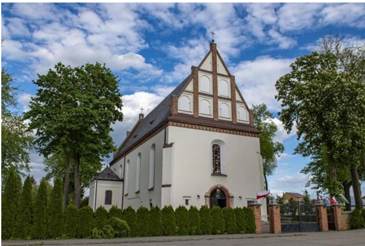
Kościół parafialny w Stanisławowie