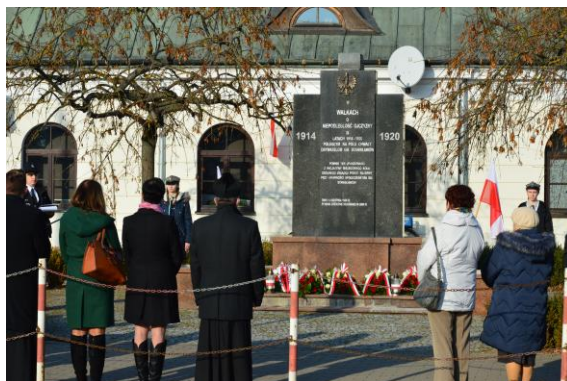
Pomnik przy GOK w Stanisławowie