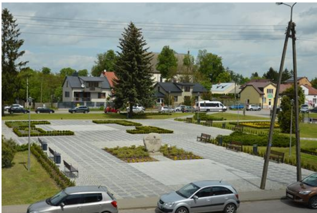
Rynek Stanisławowa – widok z Urzędu Gminy Stanisławów

Zmiany cywilizacyjne, okres transformacji ustrojowej i zwiększony w ostatnich latach rozwój budownictwa mieszkaniowego wpłynął na charakter miejscowości. W centrum Stanisławowa przeważa zabudowa jednorodzinna, murowana jedno i dwu kondygnacyjna. Rynek z przyległymi ulicami jest objęty ochroną konserwatorską. W całym Stanisławowie zdecydowanie przeważa zabudowa mieszkaniowa jednorodzinna. W ostatnich latach na terenie Stanisławowa rozwija się budownictwo jednorodzinne w zabudowie szeregowej charakterystyczne dla mniejszych miast.