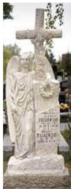
Nagrobek rodziny Masłowskich na cmentarzu parafialnym w Stanisławowie