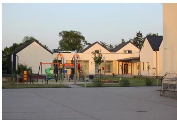
Plac zabaw przy przedszkolu w Stanisławowie

W Stanisławowie funkcjonuje ośrodek zdrowia, apteka i siedziba jednostki ochotniczej straży pożarnej, która została włączona do Krajowego Systemu Ratowniczo – Gaśniczego. W ramach jednostki działa również młodzieżowa i dziecięca drużyna pożarnicza.