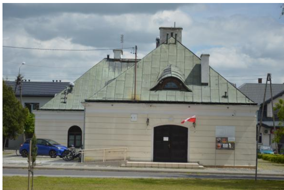
Gminny Ośrodek Kultury w Stanisławowie

mieścił szkołę, po wojnie gminną bibliotekę publiczną, klub, kino. Obecnie mieści się tu Gminny Ośrodek Kultury.